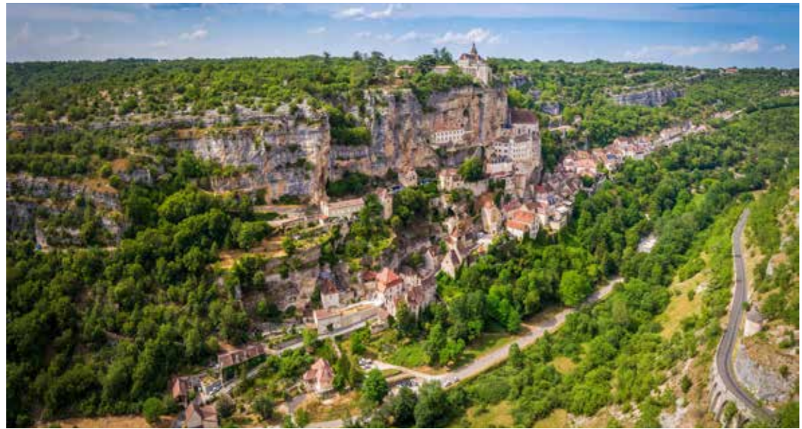
Vent d'Autan