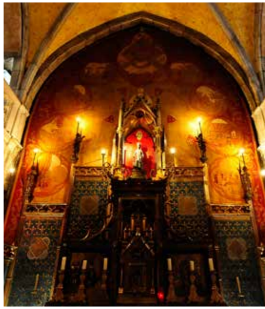
La Vierge Noire © Cochise Ory

Haut lieu de la Chrétienté depuis le Moyen-Age, Rocamadour est un véritable défi à l'équilibre. La cité sacrée et le sanctuaire, agrippés à la falaise calcaire au-dessus du canyon de l'Alzou, se déploient à la verticale en une prodigieuse superposition de rochers, de maisons, de toits bruns et de chapelles. Classées au patrimoine mondial de l'Unesco au titre des Chemins de Saint-Jacques-de-Compostelle, la basilique Saint-Sauveur et la crypte Saint-Amador sont la récompense des 216 marches du grand escalier que les pèlerins montaient à genoux pour vénérer, au creux du rocher, la statue de la Vierge Noire. La rue principale qui traverse le village est ponctuée d'anciennes portes défensives et d'échoppes, transformées aujourd'hui en boutiques et restaurants. Les belles maisons médiévales et l'Hôtel de Ville avec ses fenêtres à meneaux donnent à la cité une allure intemporelle.